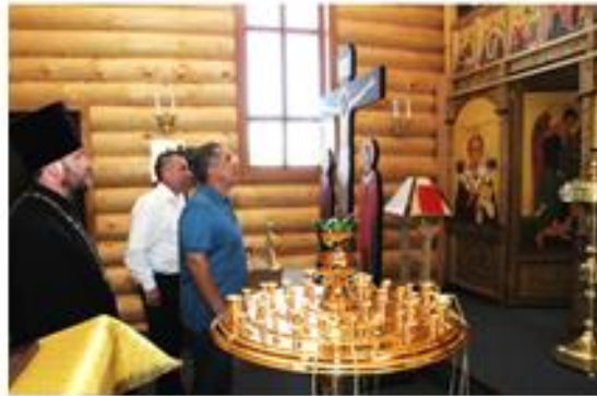
7 июля 2014 г. церковь посетил Президент РТ Р.Н. Минниханов